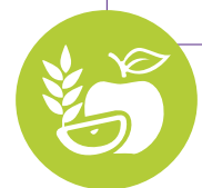
Figura 35. Diseño y participación en procesos de gestión política para la resiliencia alimentaria con perspectiva de género