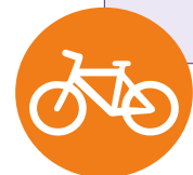
Figura 30. Comunicación con perspectiva de género para la movilidad urbana