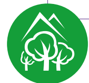
Figura 8. Mapeo social con perspectiva de género para línea base de proyectos sobre bosques, biodiversidad y ecosistemas