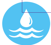
Figura 19. Participación de las mujeres en procesos de gestión del agua