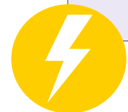
Figura 15: Integración de la perspectiva de género en la comunicación para incentivar la eficiencia energética