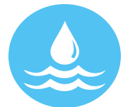
Figura 20. Comunicando la gestión del agua con perspectiva de género