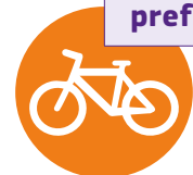
Figura 25. Identificación de patrones de movilidad y preferencias de mujeres y hombres como parte de la línea base de proyecto