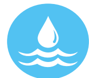
Figura 17. Gestión del agua con perspectiva de género para la gestión del agua