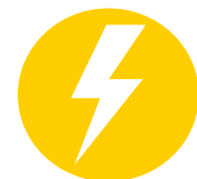
Figura 11. Identificación de necesidades, usos domésticos y productivos, y percepciones sobre eficiencia energética por parte de mujeres y