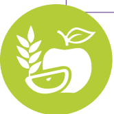
Figura 33. Identificación de actividades y participantes en la cadena de valor con perspectiva de género