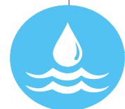
Figura 16. Identificación de línea base con perspectiva de género para la gestión del agua