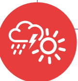
Figura 24. Implementación de gestión del riesgo con perspectiva de género