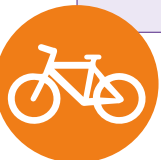
Figura 28. Incrementando la participación de las mujeres en la cadena de valor de la movilidad urbana