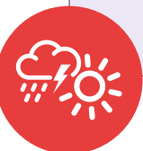
Figura 22. Sistemas de alerta temprana y perspectiva de género