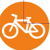
Figura 26. Diseño de espacios públicos con perspectiva de género