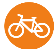
Figura 29. Participación en el diseño de la planificación de la movilidad urbana con perspectiva de género.