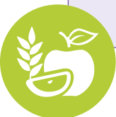
Figura 31. Mapeo social y levantamiento de línea base con perspectiva de género para producción resiliente de alimentos