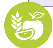
Figura 34. Creación de capacidades para la producción resiliente de alimentos con perspectiva de género