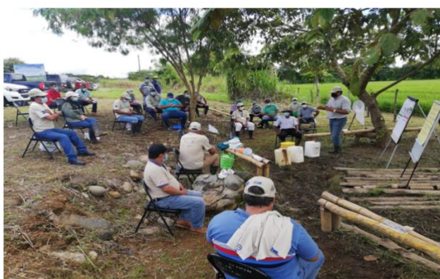
IMAGEN 2: Capacitación con protocolo de COVID19.

A nivel global, Centroamérica no es una emisora importante de GEI. Sin embargo, las emisiones agrícolas han ido en aumento. Muchos países han priorizado la adaptación de la agricultura en sus NDC con referencia a co-beneficios para la mitigación. No obstante, primeras NAMAs en la agricultura han demostrado que, aun enfocando la mitigación, a la vez se logra reforzar la adaptación y el desarrollo sostenible. Con apoyo del proyecto EUROCLIMA+, se generan nuevos conocimientos y fortalecen capacidades relativas a la mitigación de GEI con co-beneficios para adaptación, que apoyan el diseño de las NAMAs en los sectores ganadero (El Salvador) y arrocero (Panamá) y la implementación de políticas públicas en el sector agropecuario.