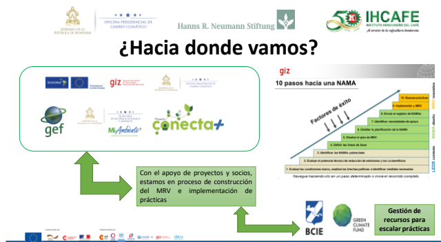
IMAGEN 3: Situación actual de la NAMA Café Sostenible de Honduras. Gabriela Jimenez, 2020

infraestructura, la reducción de desigualdades, salud y bienestar. Los beneficiarios de la implementación de la NAMA Café son definidos en función de la cadena productiva existente en el rubro, considerando que el sector caficultor en Honduras es uno de los más organizados. Caficultores, procesadores y comunidades indígenas son los más importantes. Se definen proyectos pilotos de acuerdo al tipo de actor, su rol en el proceso y al contexto geográfico, para garantizar una segunda fase de implementación a nivel nacional.